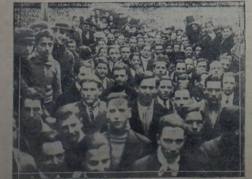
LOS CONCURRENTES A LA ASAMBLEA QUE SE EFECTUO AYER